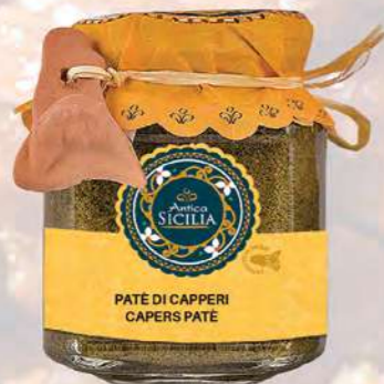
PATÈ DI CAPPERI CAPERS PATE

180 g - cod. 4026 12 pz per confezione / 12 pcs for box SCADENZA 24 MESI