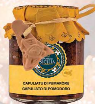
CAPULIATU DI PUMARORU CAPULIATO DI POMODORO

SPIZZICO SICILIANO SPIZZICO SICILIANO 180 g - cod. 4069 12 pz per confezione / 12 pcs for box SCADENZA 24 MESI