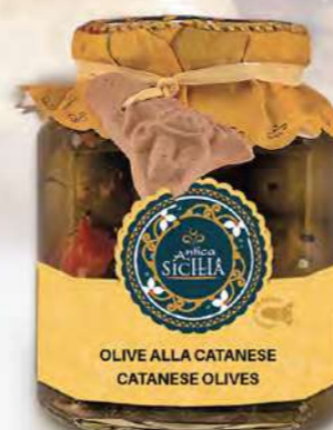
OLIVE ALLA CATANESE CATANESE OLIVES

Barattolo / Jar: 280 g - cod. 4004 12 pz per conf. / 12 pcs for box SCADENZA 24 MESI