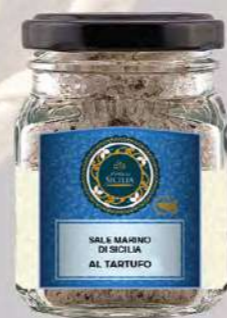
SALE MARINO DI SICILIA AL TARTUFO SICILIAN SEA SALT WITH TRUFFLE

Barattolo / Jar: 100 g - cod. 01?? 24 pz per confezione / 24 pcs for box