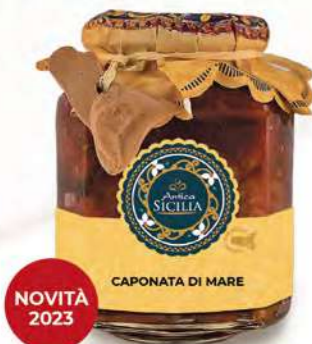
CAPONATA DI MARE SEA CAPONATA

Barattolo / Jar: 280 g - cod. 4099 12 pz per confezione / 12 pcs for box SCADENZA 24 MESI