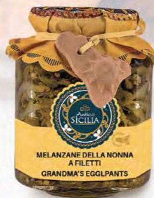
MELANZANE DELLA NONNA A FILETTI GRANDMA'S EGGPLANTS

Barattolo / Jar: 180 g - cod. 4008 12 pz per conf. / 12 pcs for box SCADENZA 24 MESI