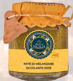
PATÈ DI MELANZANE EGGPLANTS PATE

180 g - cod. 4026 12 pz per confezione / 12 pcs for box SCADENZA 24 MESI