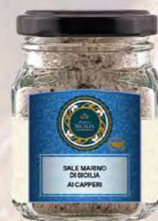
SALE MARINO DI SICILIA AI CAPPERI SICILIAN SEA SALT WITH CAPERS

Barattolo / Jar: 100 g - cod. 0200 24 pz per confezione / 24 pcs for box