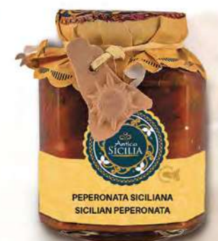
PEPERONATA SICILIANA SICILIAN PEPERONATA

Ingredients: Fresh aubergines, fresh peppers in variable quantities, tomato pulp, celery, capers, pine nuts, onions, grapes sultanas, swordfish, shrimps, e.v.o. oil, sugar, apple cider vinegar