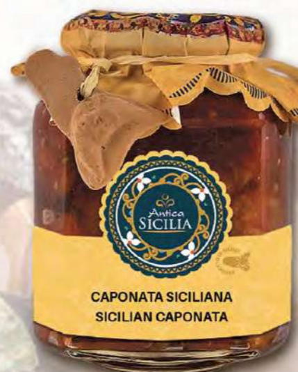
CAPONATA SICILIANA SICILIAN CAPONATA

Barattolo / Jar: 280 g - cod. 4001 12 pz per conf. / 12 pcs for box SCADENZA 24 MESI