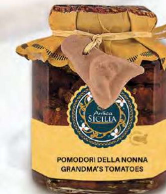
POMODORI DELLA NONNA GRANDMA'S TOMATOES

Barattolo / Jar: 200 g - cod. 4082 12 pz per conf. / 12 pcs for box SCADENZA 24 MESI