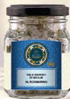
SALE MARINO DI SICILIA AL ROSMARINO SICILIAN SEA SALT WITH ROSEMARY

Barattolo / Jar: 100 g - cod. 0111 24 pz per confezione / 24 pcs for box