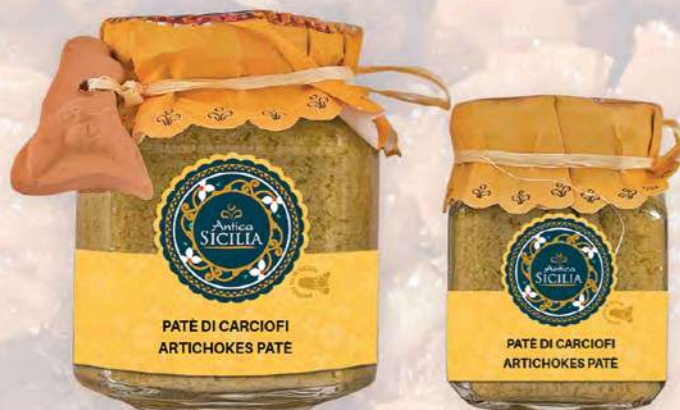
PATÈ DI CARCIOFI ARTICHOKES PATE

CAPULIATU DI PUMMARORU CAPULIATO DI POMODORO 180 g - cod. 4095 12 pz per confezione / 12 pcs for box SCADENZA 24 MESI