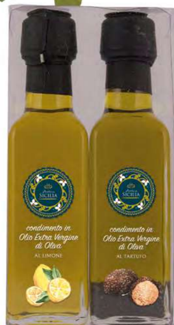
CONFEZIONE DA 2 BOTTIGLIE 10 CL BOX OF 2 BOTTLE 10 CL

Bottiglia 10 cl / Bottle 10 cl 2 pz per confezione / 2 pcs for box