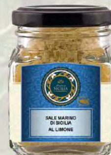
SALE MARINO DI SICILIA AL LIMONE SICILIAN SEA SALT WITH LEMON

Barattolo / Jar: 100 g - cod. 0166 24 pz per confezione / 24 pcs for box