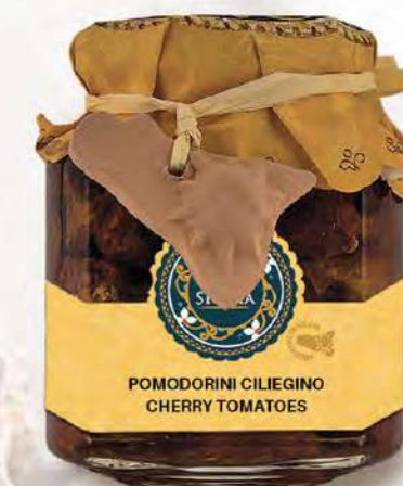
POMODORINI CILIEGINO CHERRY TOMATOES

Ingredients: Fillets of aubergines, dried tomatoes, artichokes, crushed green olives, black olives, garlic, oregano, wine vinegar and e.v.o. oil