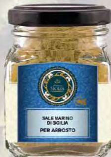
SALE MARINO DI SICILIA PER ARROSTO SICILIAN SEA SALT FOR ROAST

Barattolo / Jar: 100 g - cod. 02?? 24 pz per confezione / 24 pcs for box