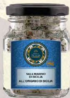
SALE MARINO DI SICILIA ALL'ORIGANO DI SICILIA SICILIAN SEA SALT WITH SICILIAN OREGANO

Barattolo / Jar: 100 g - cod. 0100 24 pz per confezione / 24 pcs for box