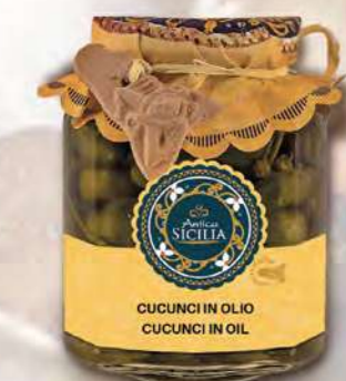
CUCUNCI IN OLIO CUCUNCI IN OIL

Ingredients: Fresh pepperoni, onion, almonds, mint, sultanas, e.v.o. oil