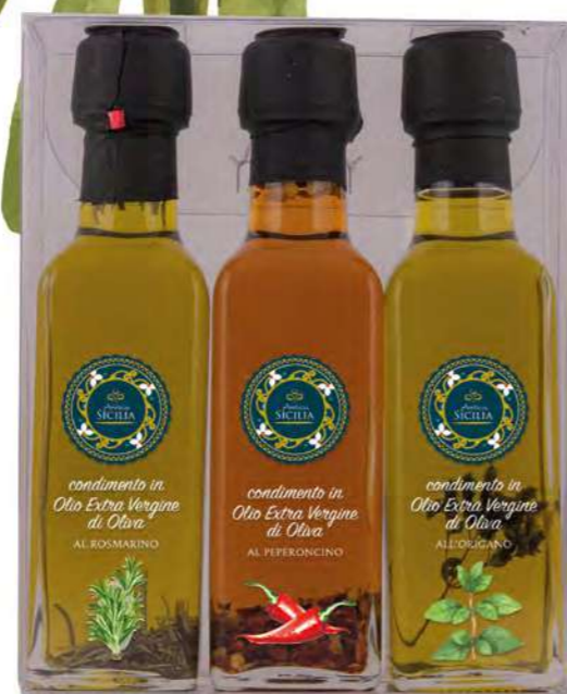
CONFEZIONE DA 3 BOTTIGLIE 10 CL BOX OF 3 BOTTLE 10 CL

Bottiglia 10 cl / Bottle 10 cl 3 pz per confezione / 3 pcs for box