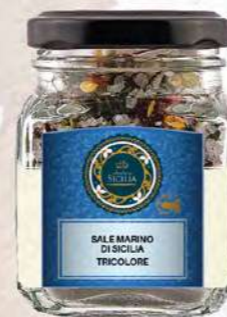
SALE MARINO DI SICILIA TRICOLORE SICILIAN SEA SALT THREE COLOR

Barattolo / Jar: 100 g - cod. 0122 24 pz per confezione / 24 pcs for box