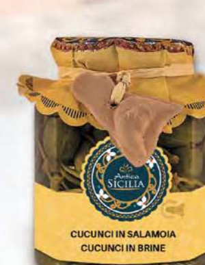
CUCUNCI IN SALAMOIA CUCUNCI IN BRINE

Barattolo / Jar: 280 g - cod. 4009 12 pz per conf. / 12 pcs for box SCADENZA 24 MESI