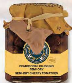
POMODORINI CILIEGINI SEMI-DRY SEMI-DRY CHERRY TOMATOES

Barattolo / Jar: 130 g - cod. 4075 12 pz per conf. / 12 pcs for box SCADENZA 24 MESI