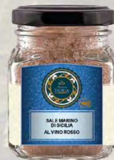
SALE MARINO DI SICILIA AL VINO ROSSO SICILIAN SEA SALT WITH RED WINE

Barattolo / Jar: 100 g - cod. 0211 24 pz per confezione / 24 pcs for box