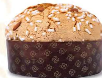
IL PANETTONE TRADIZIONALE