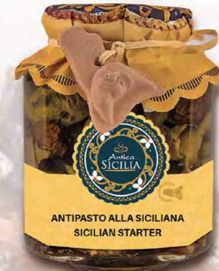
ANTIPASTO ALLA SICILIANA SICILIAN STARTER

Ingredients: Fresh eggplants, fresh pepperoni, tomatoes, carrots, celery, sultanas, pine nuts, capers, onion, wine vinegar, sugar and e.v.o. oil