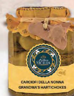
CARCIOFI DELLA NONNA GRANDMA'S HARTICHOKES

Barattolo / Jar: 280 g - cod. 4002 12 pz per conf. / 12 pcs for box SCADENZA 24 MESI