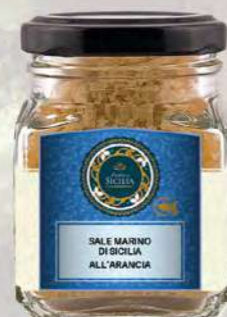
SALE MARINO DI SICILIA ALL'ARANCIA SICILIAN SEA SALT WITH ORANGE

Barattolo / Jar: 100 g - cod. 0188 24 pz per confezione / 24 pcs for box