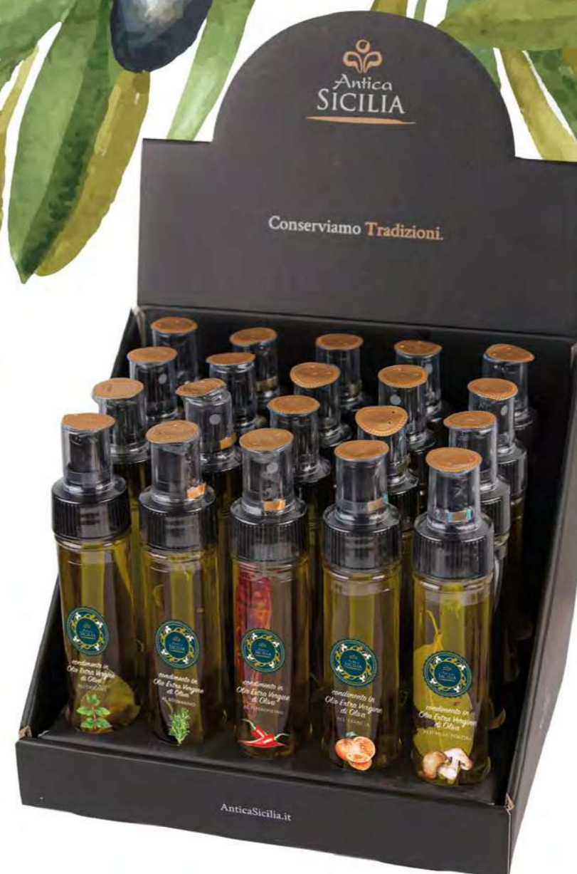
ESPOSITORE PER OLIO SPRAY 5 CL DISPLAY FOR SPRAY OIL 5 CL

Spray 5 cl 20 pz per confezione / 20 pcs for box