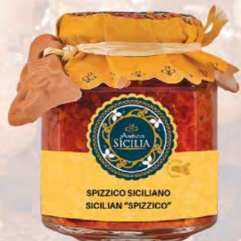
SPIZZICO SICILIANO SICILIAN "SPIZZICO"

180 g - cod. 4028 12 pz per confezione / 12 pcs for box SCADENZA 24 MESI