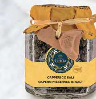
CAPPERI CO' SALI CAPERS PRESERVED IN SALT

Barattolo / Jar: 280 g - cod. 4081 12 pz per confezione / 12 pcs for box SCADENZA 24 MESI