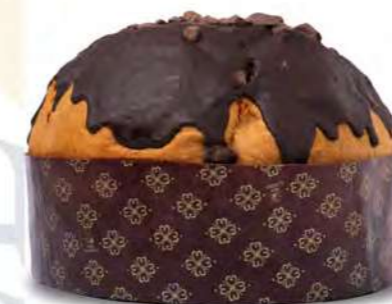
IL PANETTONE AL CIOCCOLATO