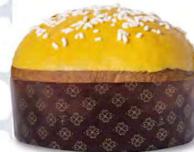
IL PANETTONE AL MANDARINO